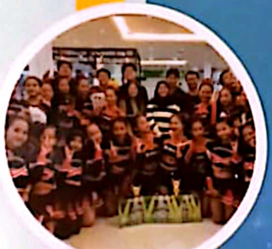
Juara 1 Kejurda Cheerleading