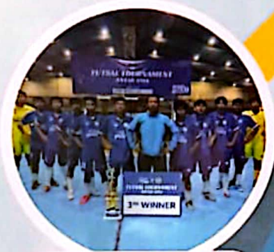
Juara 3 Futsal Tournament