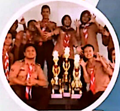
Juara 2 Pioneering Pramuka